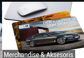
Merchandise & Aksesoris