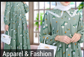
Apparel & Fashion