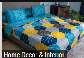
Home Decor & Interior